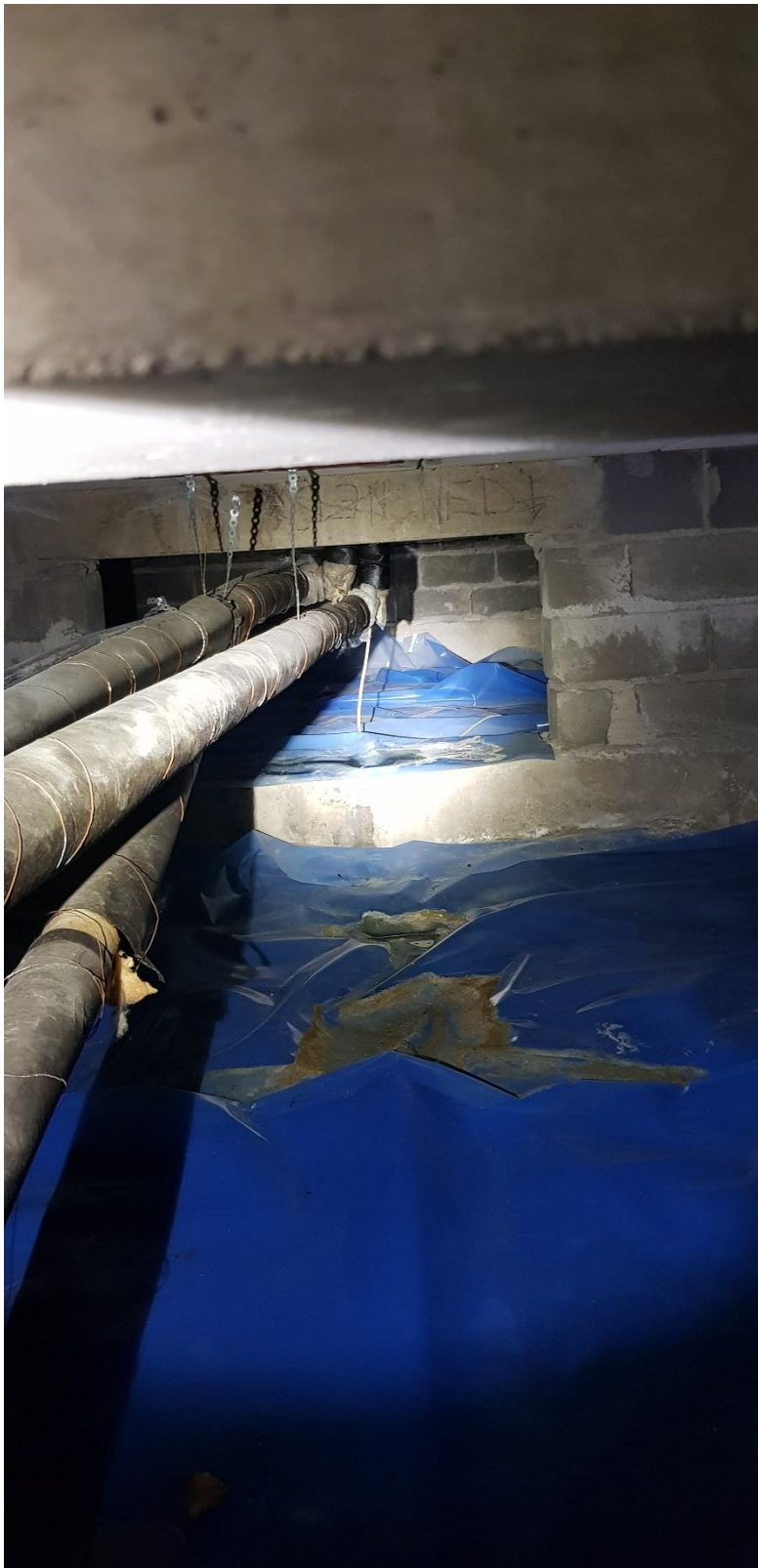
Figur 1 Vattensamling under ett droppande vatten rör