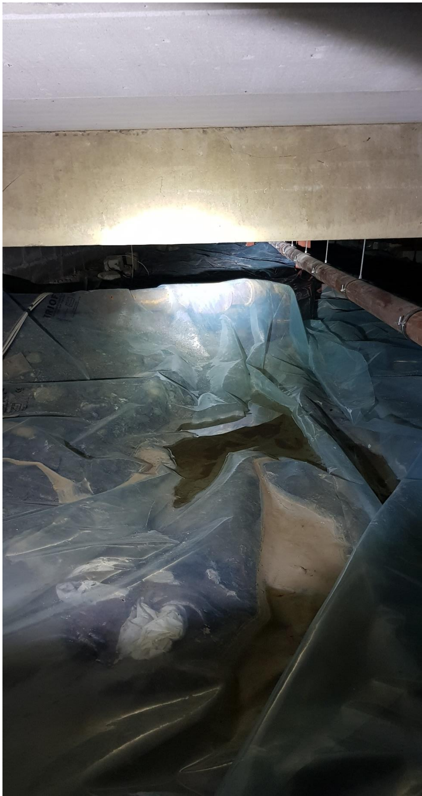
Figur 1 Vattensamling under ett droppande vatten rör