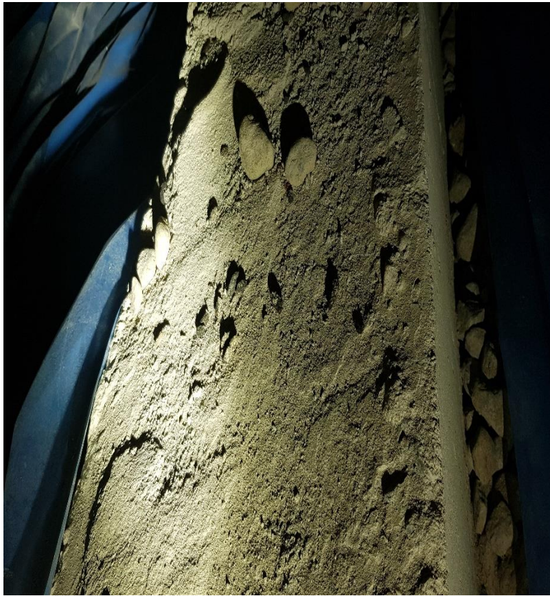
Gammal avföring från Råtta