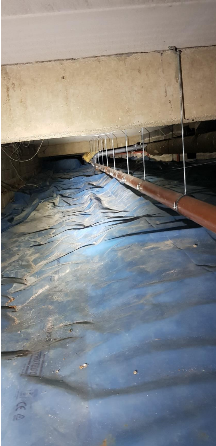
Översiktsbild av grund