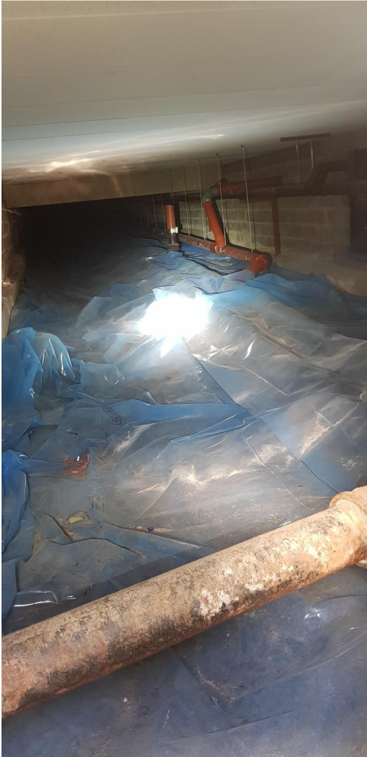
Översiktsbild av grund